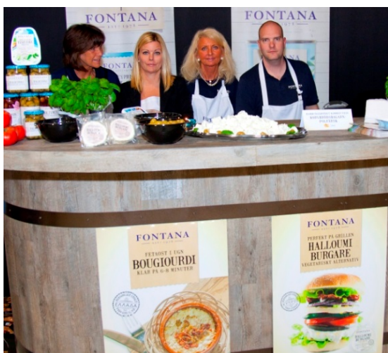
Fontana kom med fyra trevliga säljare som dukade upp med bl a Halloumiburgare.