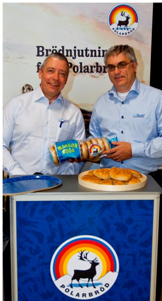
Varmt välkommen vill Polarbröd hälsa med ett nytt gott bröd.

Kunnig personal ger Dig Kunglig service!