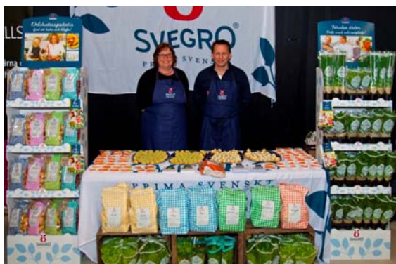
Svegro förbereder med smakprover inför festen med Kvantums kunder.