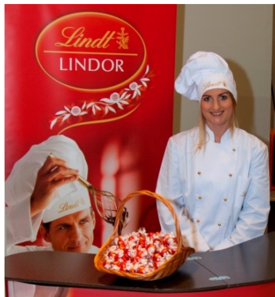
Lindt bjöd på god choklad hela kvällen.