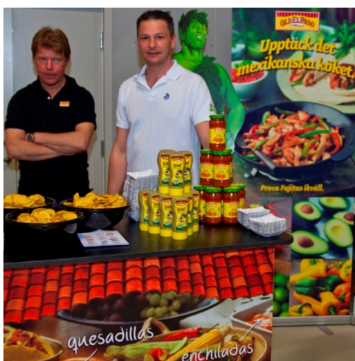
Killarna från Old el Paso förbereder för att bjuda Kungens kunder på underbara mexikanska smaker.